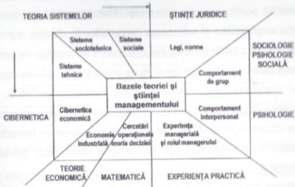
Fig. 1.3. Relația managementului cu alte științe.

Pentru studiul ansamblului este necesară o disciplină specială, care este managementul industrial .