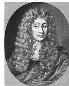
John Erskine - comte de Mar.